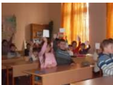
Игра "Я это Я".

Сегодня мы постараемся ответить на данные вопросы.