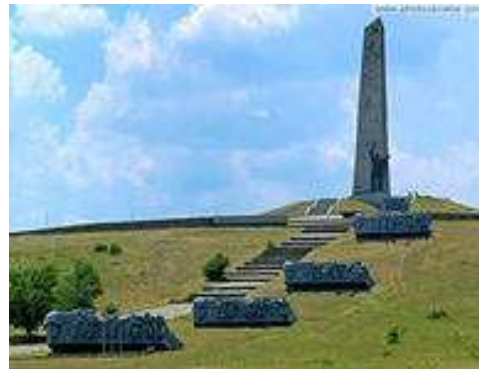
Савур – Могила ( современное фото)

Войска получили возможность выйти на оперативный простор и громить гитлеровцев, освобождая города и села Донбасса, направляя все силы на быстрейшее освобождение центра Донбасса – Сталино.